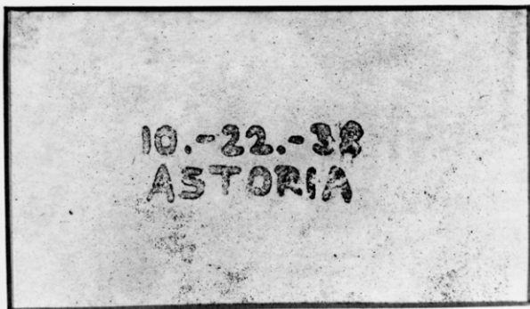
Фото. На копии, которая хранится в Смитсоновском институте, значится: «10-22-38 ASTORIA». Темная рамка по краям изображения – это границы предметного стекла.

Так, впервые в истории была получена первая ксерокопия. Дата 22.10.1938 – день рождения ксерографии.