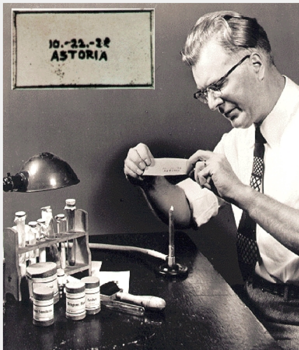
Фото. Нагрев вощеной бумаги закрепляет изображение

Так, впервые в истории была получена первая ксерокопия. Дата 22.10.1938 – день рождения ксерографии.