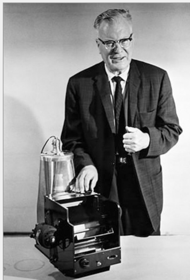
Фото. Честер Карлсон с одним из первых аппаратов для ксерокопирования

Карлсону было 32 года, когда он сделал свое изобретение, но судьба распорядилась так, что первый коммерческий копирующий аппарат появился только через 20 лет. Все эти годы для Карлсона были заполнены борьбой и разочарованиями, лишениями и трудом. Достаточно вспомнить, что в какое-то время он ознакомил со своим изобретением двадцать крупнейших фирм, в том числе IBM и General Electric, занимавшихся изготовлением оргтехники, но шесть лет подряд встречал, по его словам, «только воодушевленное отсутствие заинтересованности».