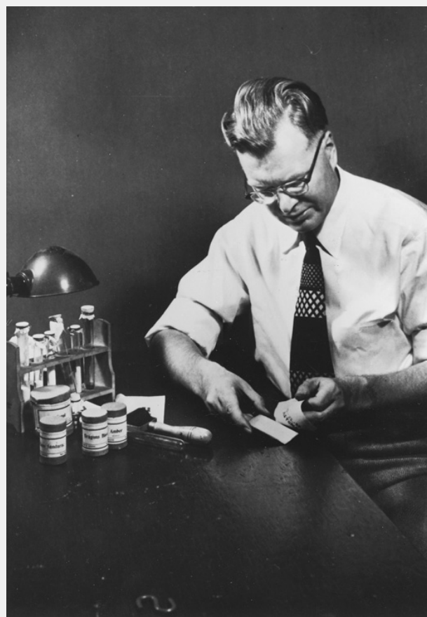
Фото. Частицы порошка перенесены на вощеную бумагу

В дальнейшем, для проявления Карлсон использовал трибоэлектрический эффект, давно известный в физике. Он смешивал порошки сурика и серы (частицы которых, контактируя друг с другом при трении – перемешивании, заряжаются противоположными зарядами) и опылял пластинку серы. Частицы красного сурика проявляли скрытое изображение.